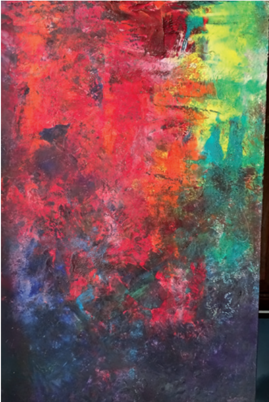
Conrad Sevens; Bunte Welt ; Öl auf Hartfaser, 100 cm x 60 cm, 2017 © VG Bild-Kunst, Bonn 2020

Ausstellung bis zum 12. Juli 2020 in der Kunststation Kleinsassen