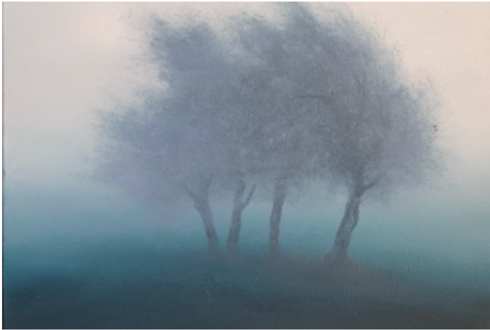
Conrad Sevens; Bäume im Wind ; Öl auf Leinwand, 40 cm x 50 cm, 2020 © VG Bild-Kunst, Bonn 2020

dem er eine erinnerungsträchtige Vermittlung erschaffen hat, die frei ist von Begrenzungen, Einengungen, Analogien und Vergleichen. An deren Stelle tritt der Wirklichkeitsbezug einer ahnungsvollen Empfindung beim Erstellen eines solchen Werks. Wie er jedoch diese leuchtende Farbkraft - Conrad Sevens malt ausschließlich in Öl - mit seinen Spachtelarbeiten erzeugt, bleibt sein persönliches Geheimnis. Diese Werke ziehen unsere Blicke auf sich und verharren im Fokus der Betrachter. Mit all diesen interaktiven Aufträgen, welche immer wieder neuerliche Strukturen formulieren, samt diversen Verreibungen mittels Spachtel, Tuch und Pinsel. Sevens unternimmt mit und in seinen Werken eine stetige Weiterentwicklung, die einer schier endlosen Reise ähnlich ist. Dies entspricht auch dem Konzept der speziell von ihm entwickelten Lasurtechnik. Die wird exemplarisch deutlich hinsichtlich der Herangehensweise und konstruktiven Beschaffenheit bei seinem Werk „Himmelrot“, welches ebenfalls nun in der aktuellen Ausstellung zu sehen ist, in dem